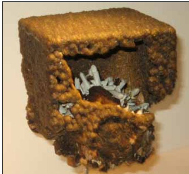
"The siderite box" : een hol siderietkristal met daarin kwarts-kristallen. Virtuous Lady Mine, Buckland Monachorum, Whitchurch, Tavistock District, Devon, England, Groot-Brittannië.

www.mindat.org/article.php/101/The+Vault+--+Natural+History+Museum+London www.nhm.ac.uk/